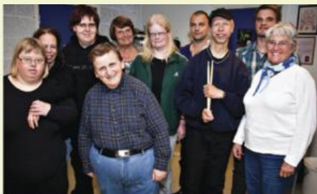
Sound of Happiness trenger frivillige og givere som kan støtte økonomisk. Takk dersom du vil bidra.